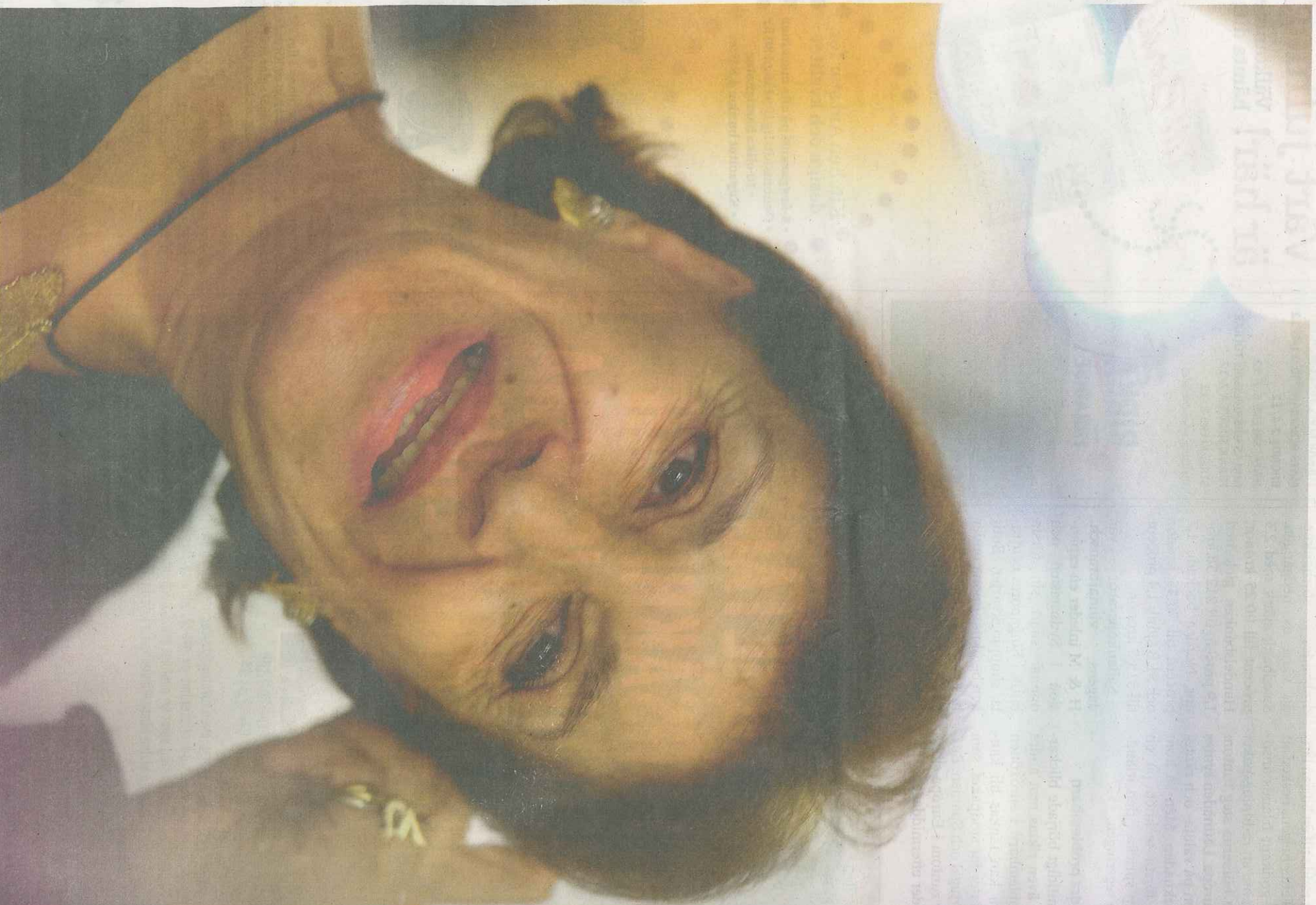
Stark kvinna. I snart 40 år har Mahnaz Afkhami slagits för kvinnors rättigheter och har orkat fortsätta, trots hårda bakslag.

Bakom våldet mot kvinnor finns ofta en patriarkal samhällssyn och kampen för jämställdhet möter ett tungt motstånd. Det vet, inte minst, iranska Mahnaz Afkhami. På 70-talet utsågs hon till en av världens första jämställdhetsministerar och lyckades förändra villkoren för Irans kvinnor med bland annat satsningar på barnomsorg och betald mammaledighet. Sedan kom revolutionen.